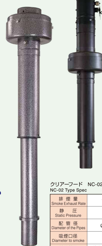
クリアーフード NC-02型仕様 / NC-02 Type Spec

※2VC機種は伸縮可能です。天井高さに合わせたS、M、Lサイズがありますので、お気軽にお問い合わせください。