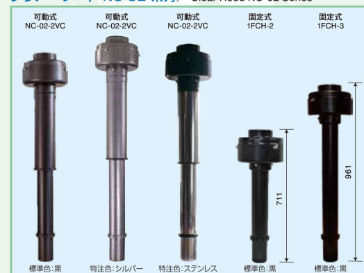
クリアーフード NC-02 系列 / Clear Hood NC-02 Series

※2VC機種は伸縮可能です。天井高さに合わせたS、M、Lサイズがありますので、お気軽にお問い合わせください。